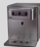
RAIN 120 TOP INOX