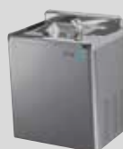
RA 5 UP INOX