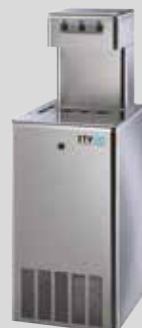
RAIN 120 INOX