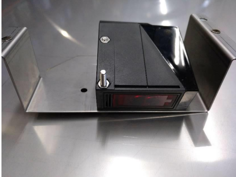
Fotocellula montata su supporto