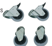
4 WHEELS KIT KIT 4 ROUES