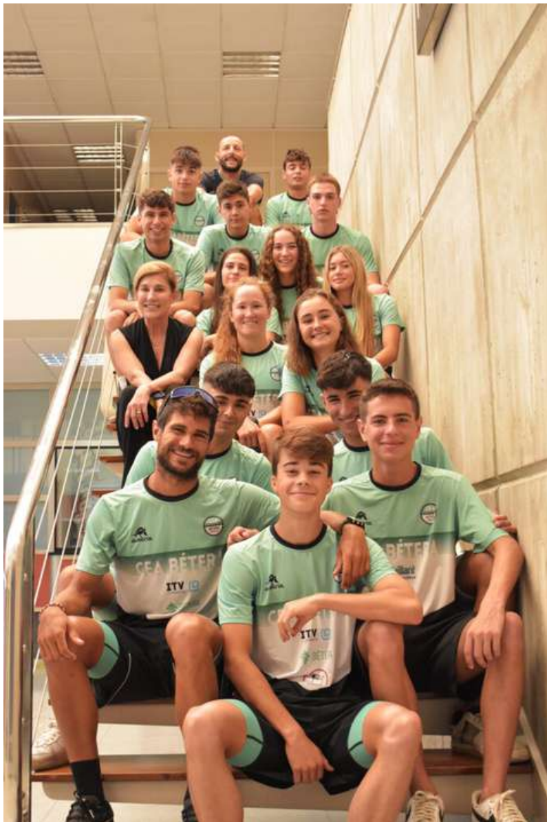
CEA DE BÉTERA

Participación, apoyo y colaboración con numerosos clubes para el fomento de los valores asociados deporte (esfuerzo, resiliencia y superación) y la promoción del deporte femenino, paralímpico y local de la Comunidad Valenciana .