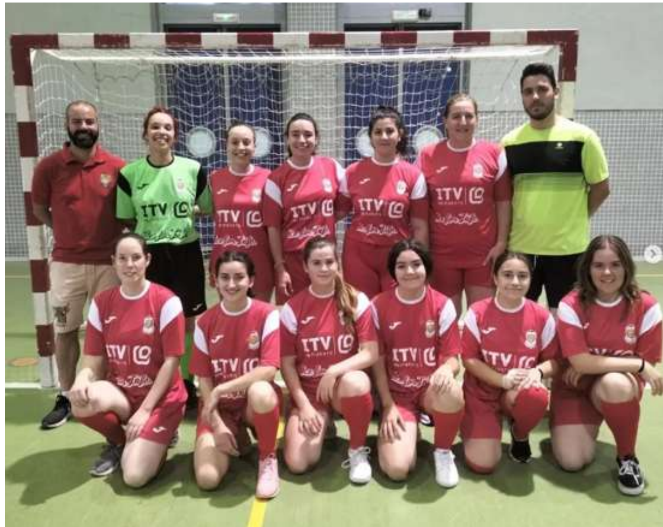
CLUB FÚTBOL FALLA ANTONIO PARDO

Participación, apoyo y colaboración con numerosos clubes para el fomento de los valores asociados deporte (esfuerzo, resiliencia y superación) y la promoción del deporte femenino, paralímpico y local de la Comunidad Valenciana .