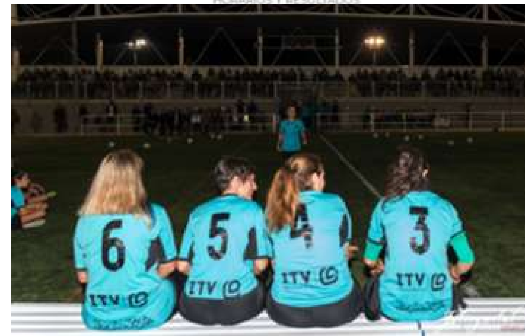
CLUB FÉNIX DE MONCADA