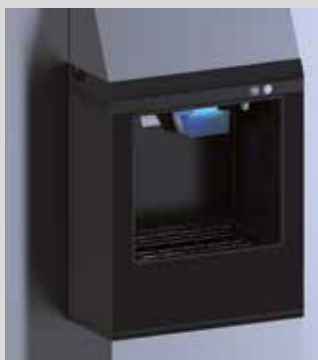
ANTI-FREEZE SYSTEM TRINQUETE ANTI-HIELO FANTASMA