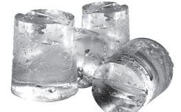
S. STAR 48/52cc